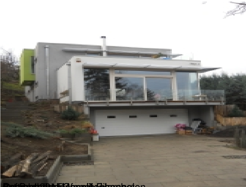
Beauftragter: F&G Immobilien