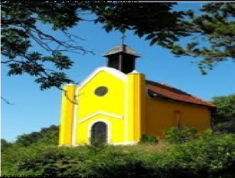
Beauftragter: Kirchenbau und Stein